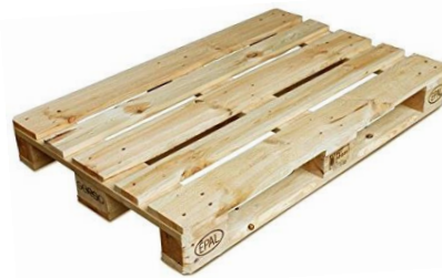
nová EURO paleta