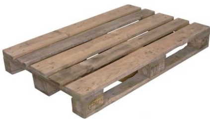
použitá EURO paleta

S účinností od 1. 3. 2022 není rozlišováno paleta EURO nová/použitá. Při vrácení EURO palet tedy není na straně Arkys, s.r.o. určován storno poplatek za účelem stanovení stupně opotřebení vrácených obalů.